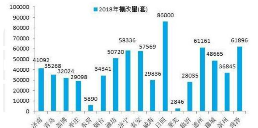
图3 山东省各市 2018 年棚改力度很大

农村在快速发展，而且新事物和老事物共存。就拿购物这件事来说，老家的农村一般会有集市，每隔 5 天一次，现在时代在发展，去城里的超市置办年货、在网上买土特产逐步流行起来，毕竟有了小轿车去市里很方便，另外村里也有快递取货点，网上购物可以直接送到村里。