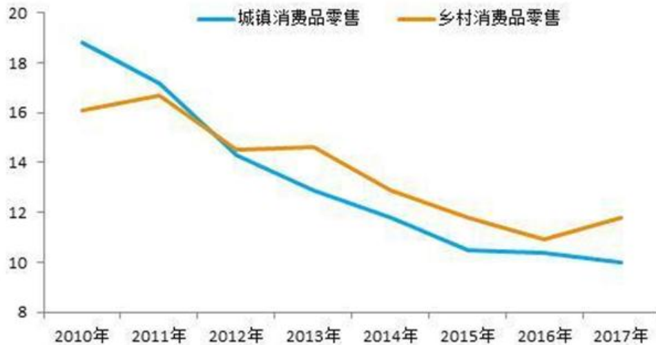
图 4 乡村消费开始甩开城镇消费